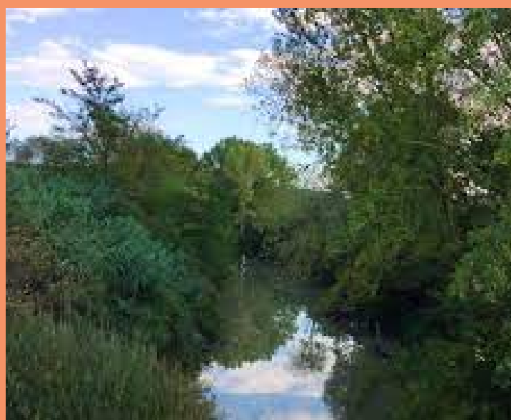
Il fiume Nestore

Nel tratto cittadino interessato dalle sponde del Nestore si intende recuperare il collegamento di vecchi camminamenti che potranno diventare percorsi verdi e ciclabili. Inoltre si vogliono collegare due parchi urbani che insieme potrebbero divenire un unico circuito verde a servizio del capoluogo. Volendo allargare ancora più l'area interessata da questo intervento si potrebbero collegare le sponde del fiume Nestore a nord-ovest verso la Ciclovia del Trasimeno e a sud est verso la Ciclovia del Tevere.